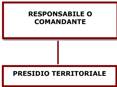
Figura T2: Schema di Comandi con unità specialistiche